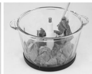
Pune mâncarea în ulcior de sticlă