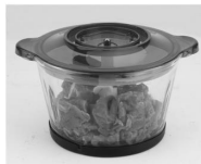
Puneți capacul transparent în poziția corectă