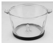
Pune ulciorul de sticlă pe orizontală