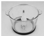
Puneți lama la masa pozității corecte