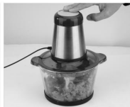
Rotiți mașina cap și apăsați capul mașinii